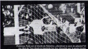
Polémica. Pudo ser el triunfo de Palestino. ¿Sandoval la sacó de adentro? El tiro libre de Toro desde la izquierda fue muy discutido por la gente tricolor

Por Raúl Pizarro P.