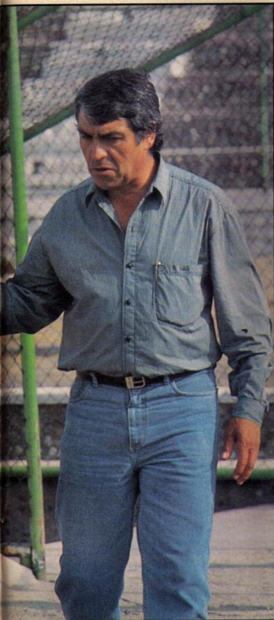
... ha cosechado diversos éxitos en su carrera. En 1992, al salir campeón su mayor orgullo: ser elegido el mejor técnico del país.